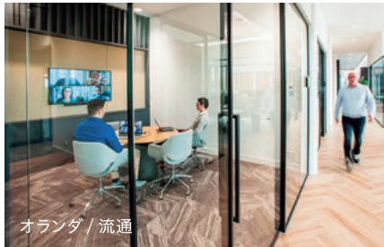
オランダ / 流通