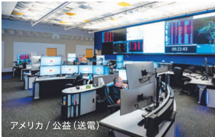
アメリカ / 公益 (送電)