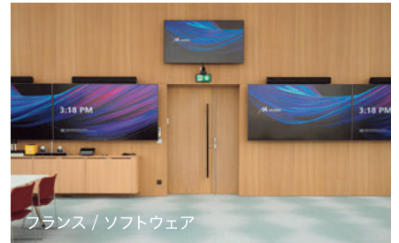
フランス / ソフトウェア