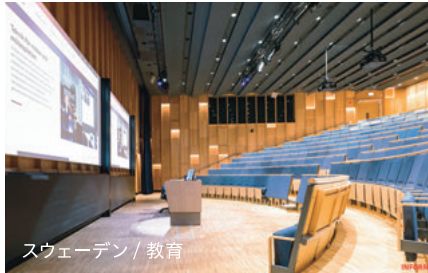
スウェーデン / 教育