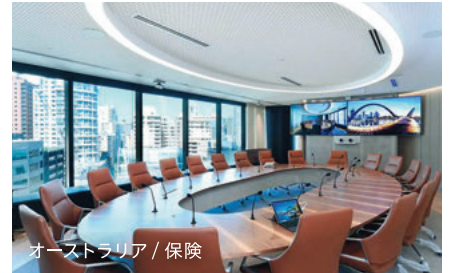
オーストラリア / 保険