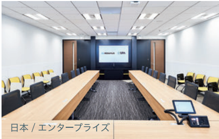
日本 / エンタープライズ

GPAは、エネルギー、金融、法務、製造、小売、教育、IT など、あらゆる業界の大手企業と連携しています。コミュニケーションとコラボレーションの改善によって、お客様の期待以上の成果を達成した事例は、世界各地に数多くあります。