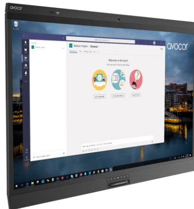
Avocor 大画面タッチディスプレイ WCD シリーズ

Avocor は、2019 年 6 月 Amsterdam にて開催された国際展示会 Integrated Systems Europe (ISE) 2019 において世界初となる「Windows Collaboration Display」(通称：WCD) の発売を発表致しました。この製品については、3 月下旬頃より日本国内でも、デモンストレーション及び販売を開始する予定です。