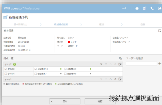
接続拠点選択画面