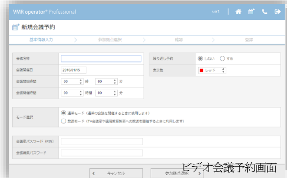
ビデオ会議予約画面